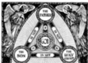
„Credința mea catolică”