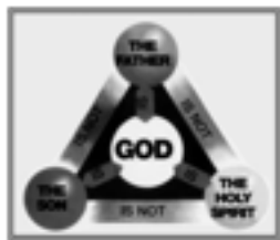
„Studii Biblice” pag. 75 AZȘ

Aș vrea să reiterez ceva ce am afirmat mai devreme: necesită un salt al credinței pentru a spune că spiritul sfânt este o persoană diferită de Tatăl și de Fiul. Da, spiritul sfânt este o persoană la fel ca Tatăl și ca Fiul, dar asta nu înseamnă automat că este o persoană diferită de ei. Aș vrea să vă explic.